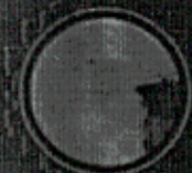
یخ خشک و آبر...